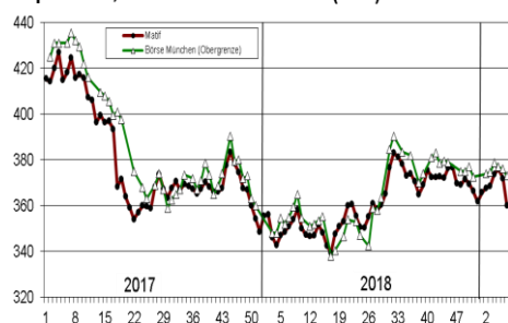
Raps Matif, GHP Börse München (€/to)