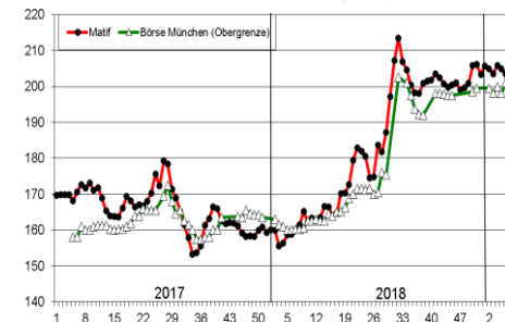
Weizen Matif, GHP Börse München (€/to)